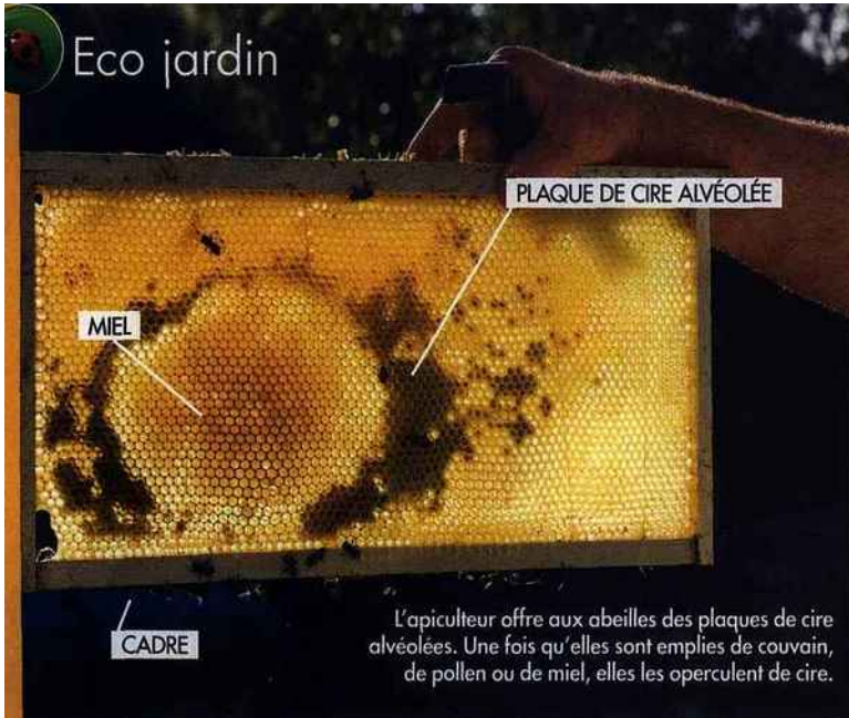
L'apiculteur offre aux abeilles des plaques de cire alvéolées. Une fois qu'elles sont emplies de couvain, de pollen ou de miel, elles les operculent de cire.

Urbain ou campagnard, tout jardin fleuri d'essences mellifères (du printemps à l'automne) et indemne de produits phytosanitaires peut accueillir une ruche. Et retenez que les abeilles n'hésitent pas à prospecter trois kilomètres à la ronde!